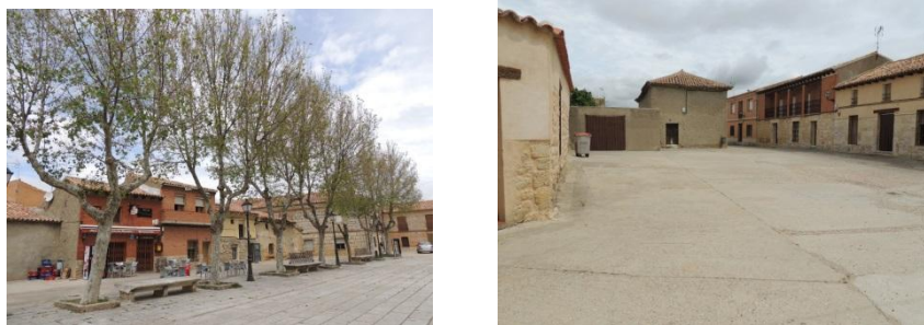
Figura 5. Aspecto actual del Corro de San Andrés (izda) y del Corro del Conde (dcha).

El Corro de San Andrés. La actual y espaciosa plaza llamada Corro de San Andrés tiene su origen a partir del derrumbe de la Iglesia de San Andrés en 1840 que ocupaba este espacio de 2.877 m 2 (Fig. 5). En la propuesta de diseño se prevé la sustitución de los Platanus hispanica por una pérgola que, de una parte, proporcione sombra en la plaza en verano y, de otra, evite los actuales problemas de levantamiento del pavimento, el mantenimiento y la controvertida poda de los árboles. La pérgola construida con una estructura ligera de acero, se inspira en la planta tipo de una iglesia románica, en cuyas peanas se situarán ejemplares de Wisteria sinensis (Fig. 3C).