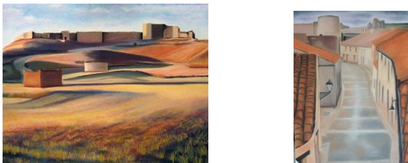
Figura 2. Representación en pastel del paisaje de Uruña (izqda) y del interior casco urbano (dcha).

recorridos. La descomunal altura de la muralla es el único punto de orientación existente en la actualidad, que se pierde al adentrarse en las callejuelas del pueblo.