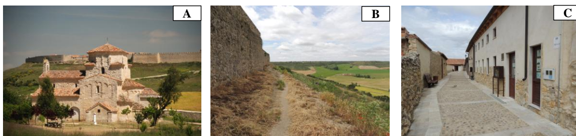
Figura 1. Ermita de la Anunciada (A), Recorrido actual extramuros (B) e Imagen de una calle de Urueña (C)

Sin embargo, y pese a que el mero “paisaje” forma parte irrenunciable del “encanto” de Urueña, no se ha acometido en ningún momento un tratamiento integral del paisaje del pueblo.