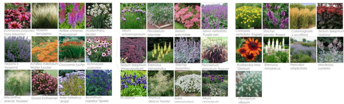
Figura 4. Relación de especies a emplear en el ajardinamiento del talud de la muralla.

La selección de especies vegetales se ha llevado a cabo teniendo en cuenta las condiciones climáticas de la zona, que se caracterizan por altas temperaturas en verano, frecuentes heladas en invierno, una marcada estacionalidad de las precipitaciones, y frecuentes e intensas rachas de viento